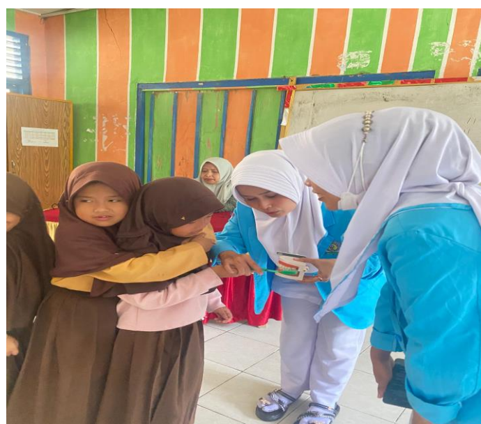
Gambar 2.3 Kegiatan PKM