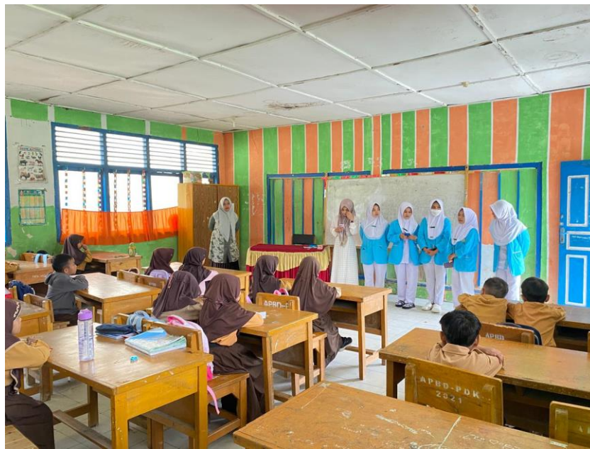
Gambar 2.2 Foto Kegiatan PK

Metode pelaksanaan dalam kegiatan ini dilaksanakan pada tanggal 27 November 2025 di dalam kelas 1 SD negeri 195/III tebat ijuk". Pelaksanaan dan pelatihan singkat ditujukan pada anak-anak kelas 1 yang belum tahu cara mengatasi infeksi pada gigi dan mulut dengan caramelakukan gerakan sikat gigi yang baik dan benar. Media dan alat yang disediakan berupa leaflet dan pantom gigi dan juga sikat gigi. Metode yang digunakan adalah penyuluhan, tanya jawab atau evaluasi. Berikut gambar pelaksanaan kegiatan :