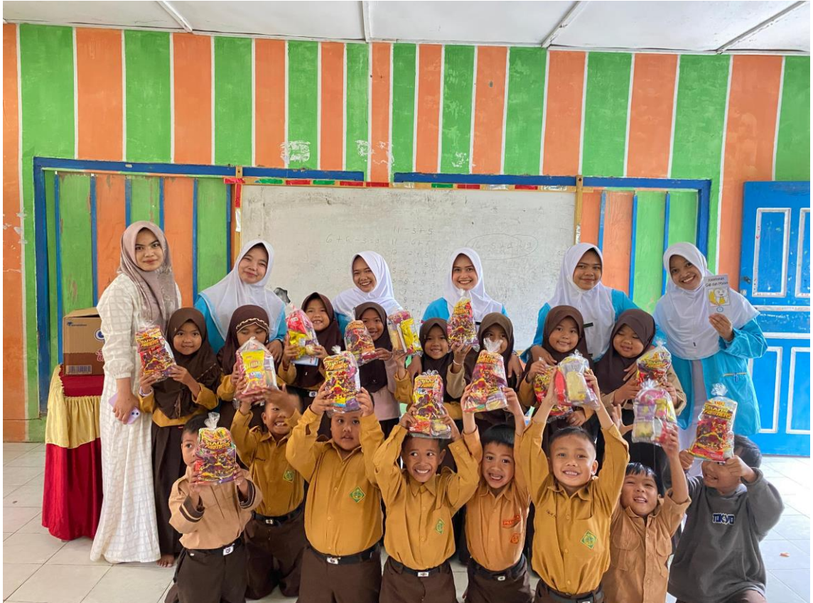
Gambar 2.4 Selesai Kegiatan PKM