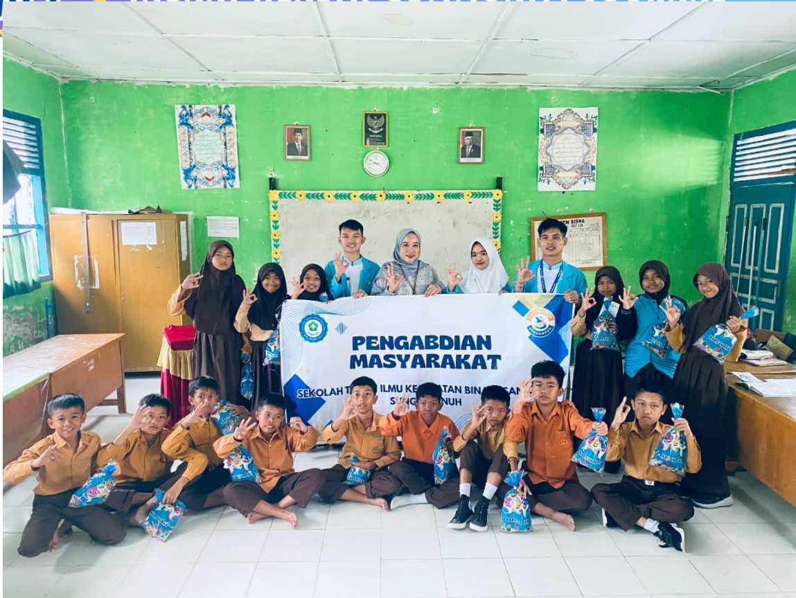
Gambar 2.3 Kegiatan PKM