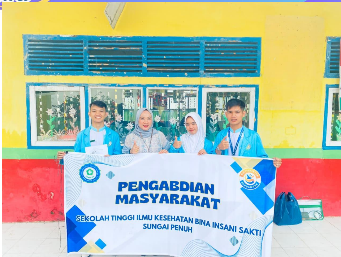
Gambar 2.4 Selesai Kegiatan PKM