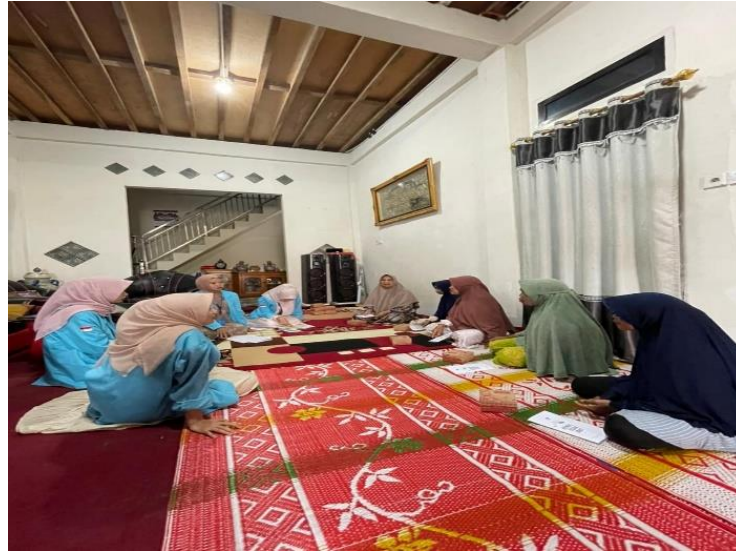
Gambar 2.2 Foto Kegiatan PKM