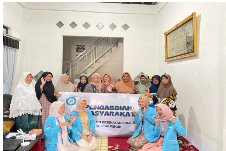
Gambar 2.4 Selesai Kegiatan PKM