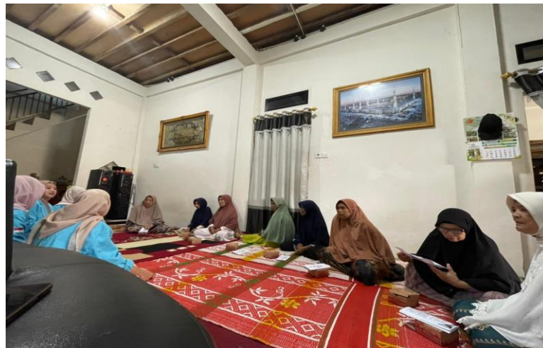
Gambar 2.3 Kegiatan PKM